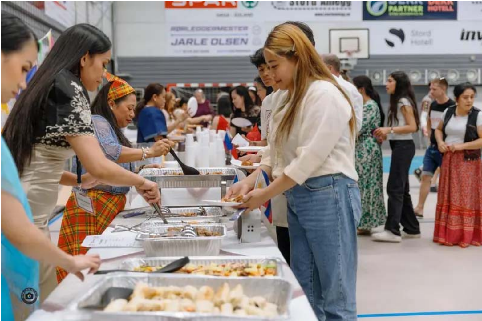
Alle fekk smaka på filippinsk mat. Matlaging og servering blei gjort på dugnad.