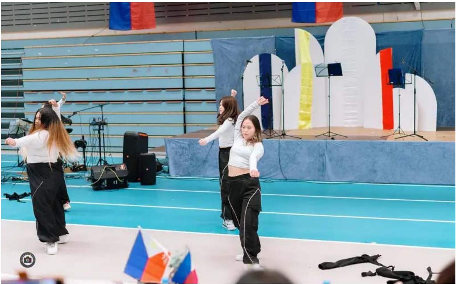
Filippinske ungdommar frå Bømlo utgjør gruppa Elites of Bømlo.