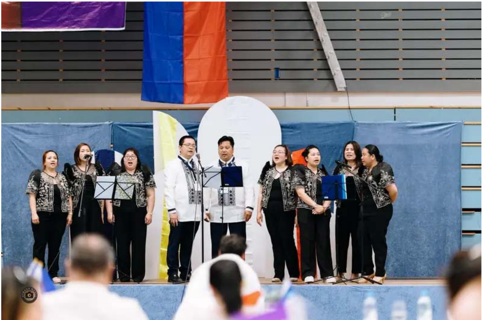
Fil-Nor Choir er det filippinske koret som syng i katolsk kapell som ligg i Nordbygdo på Stord.