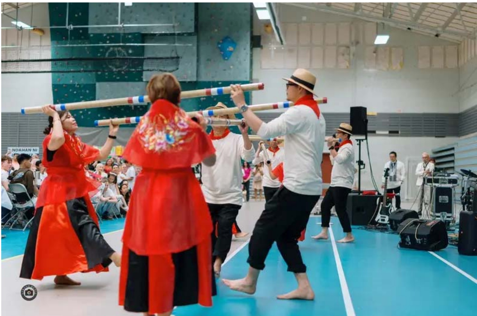
Stord Pinoy Dancemate. På biletet dansar dei filippinsk folkedans.