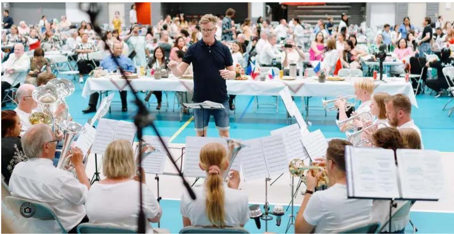
Fitjar Musikklag spelte fire melodiar.