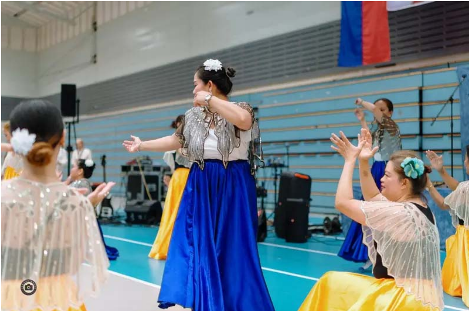
PhilZumba Dance Company frå Stord. Filippinske og thailandske kvinner som dansar zumba éin gong i veka.